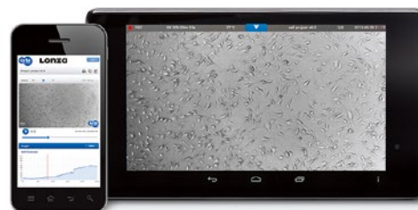
細胞培養状態をお手元のスマートフォン、タブレット、PCから観察可能