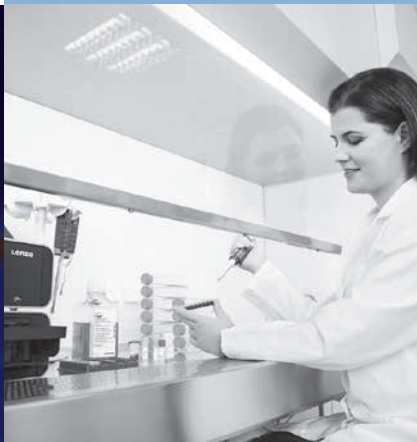
Lonza agarose for resolution, blotting and recovery